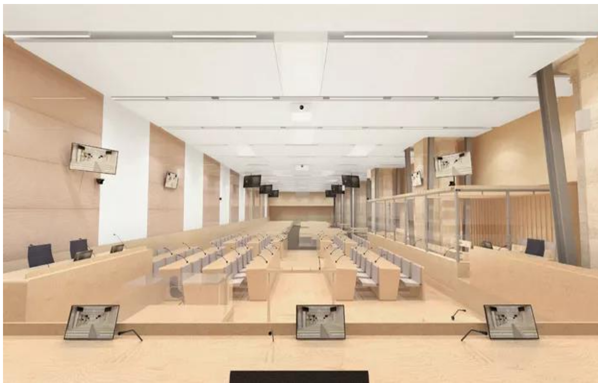
Vue de la salle d'audience où se déroulera le procès des attentats du 13 novembre 2015, depuis la table de justice. (MM ARCHITECTS DESIGNERS AND PLANNERS)

Depuis janvier 2020, la construction de la salle d'audience Grands procès a démarré au cœur de l'historique palais de justice de Paris, sur l'île de la Cité. Piloté par l'agence publique pour l'immobilier de la justice (APIJ), ce chantier aux enjeux de haute sécurité et d'accueil optimal, mobilise de nombreux acteurs du ministère de la Justice en lien avec le ministère de l'intérieur et la préfecture de Paris. En septembre 2021, cette salle d'audience de plus de 500 places sera prête à accueillir le procès des attentats du 13 novembre 2015.